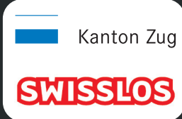
Kanton Zug Lotteriefonds