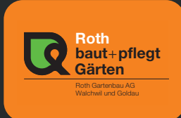
Roth Gartenbau AG