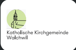
Kath. Kirchgemeinde Walchwil