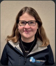
Anja Marketing / PR