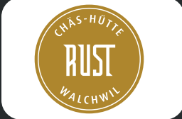
Chäs-Hütte Rust AG