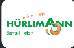
Beat Hürlimann Zimmerei - Parkett