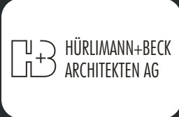
Hürlimann + Beck Architekten AG