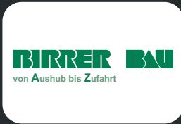
Birrer Bau AG