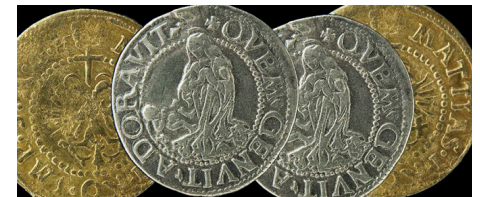
Bündner Münzen mit religiösen Motiven

Theologieprofessorin und Verwaltungsrätin der Alternativen Bank, denkt über den Umgang mit dem Mammon in der Verantwortung vor Gott und der Schöpfung nach. Prof. Aus der Au ist Thurgauer Kirchenratspräsidentin und Dozentin an der PH Frauenfeld. Musik: Duo Mondia, Oboe und Harfe.