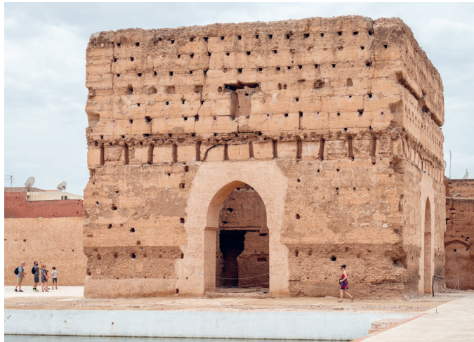
el-Badi-Palast; Marrakesh, Marokko; 2018, 34x24,3cm

Philip Heckhausen Schweizer Architekt und Fotograf