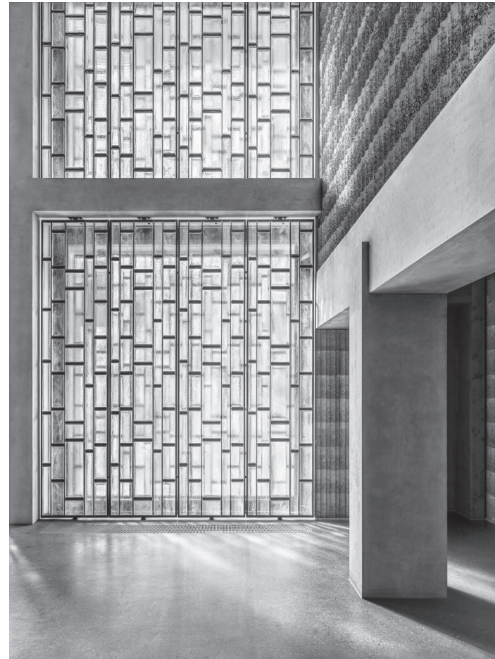
Kapelle des Alterszentrums St. Joseph

Die Aufnahmen des Projekts «Die Grosse Mauer Chinas» entstanden während einer komplizierten monatelangen Reise in den Jahren 1987/1988. Ergänzende Aufnahmen kamen 1990, 1993 und 2000 hinzu. Das Konvolut wurde in mehreren Einzel- und Gruppenausstellungen präsentiert.