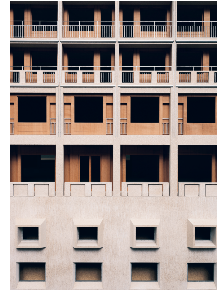
Modell für das Alterszentrum St. Josef Kloster Ingenbohl, Stampflehm Trasskalk, MDF, Birnenholz, Fichtenholz, Acrylplatten, Aluminiumrohre, Stahlstäbe; 1:50, 91x70x77cm