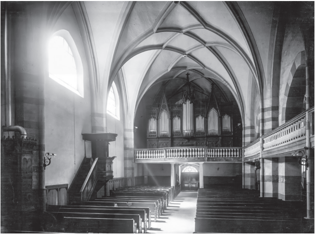
St. Martinsorgel bis 1917.