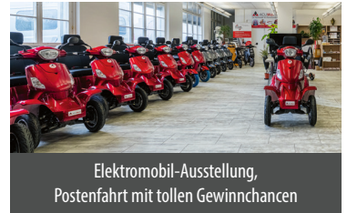
Elektromobil-Ausstellung, Postenfahrt mit tollen Gewinnchancen