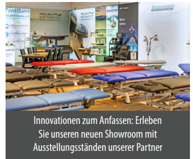
Innovationen zum Anfassen: Erleben Sie unseren neuen Showroom mit Ausstellungsständen unserer Partner