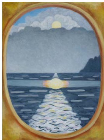
Caroline Bachmann, Double arc-en-ciel , 2019, Öl auf Leinwand, 170 x 130 cm / Soleil reflet avec cadre , 2014, Öl auf Leinwand, 40 x 30 cm