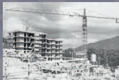
Mémoires d'ici, Fonds Le Jura bernois

Mémoires d'ici, centre de recherche et de documentation du Jura bernois