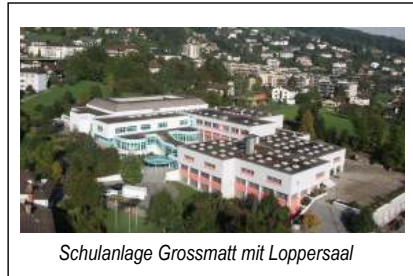
Schulanlage Grossmatt mit Loppersaal

Ein reichhaltiges und vielseitiges Wahlangebot für alle Klassen ergänzt den obligatorischen Unterricht. Das durchlässige Schulsystem erlaubt die Förderung nach Stärke und Neigung der einzelnen Schülerinnen und Schüler.