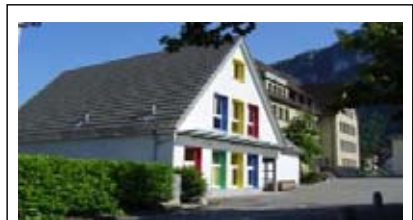
In der „Villa Kunterbunt“ ist die Grundstufe Dorf untergebracht. Im Hintergrund das Dorfschulhaus an der Seestrasse.

Eine separate Broschüre informiert über alle wesentlichen Aspekte.