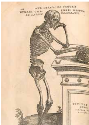
ANDREAS VESALIUS DE HUMANI CORPORA FABRICA LIBRI SEPTEM 2. AUFLAGE (1555)