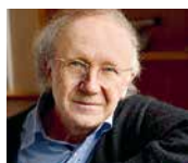
Heinz Holliger Dirigent, Komponist, Oboist mit Weltruf