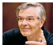
Milan Turkovic Dirigent, Fagottist und Buchautor