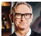
Thomas Gut Monsol Foundation