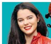
Estelle Revaz Cellistin, National- rätin Genf