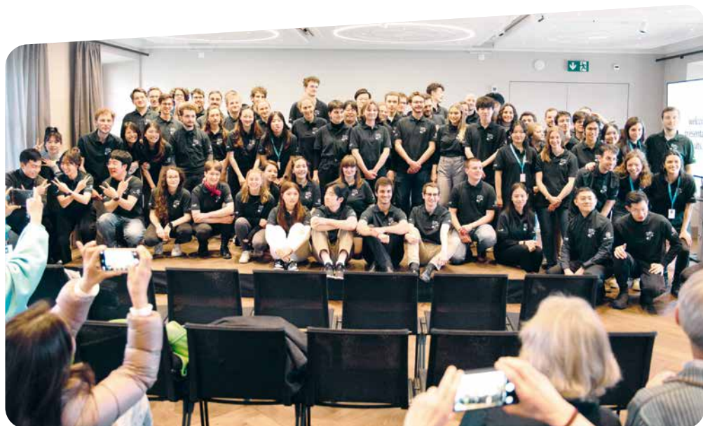
Alle Teilnehmenden The Muri Competition 2023 nach der 1. Runde.