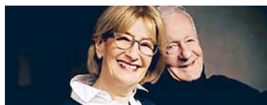
Elisabeth und Hans Widmer EHW-Stiftung, Oberwil-Lieli