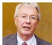
Urs Ziswiler Ehrenpräsident Rach- maninoff-Stiftung und ehemaliger Botschafter