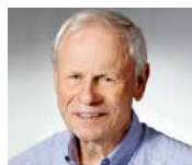
Dr. Josef Gut Stiftung für Klassische Musik Muri

Persönlichkeiten aus Musik, Sport, Politik und Gesellschaft, die uns als Freunde, Förderer und Wegbegleitende verbunden sind.