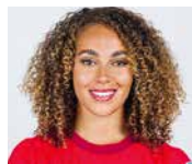
Alayah Pilgrim Fussballerin, Schweizer National- mannschaft, AS Roma