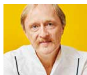
Albrecht Mayer Solo-Oboist der Berliner Philharmoniker